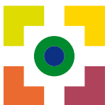
kiezen in verantwoordelijkheid